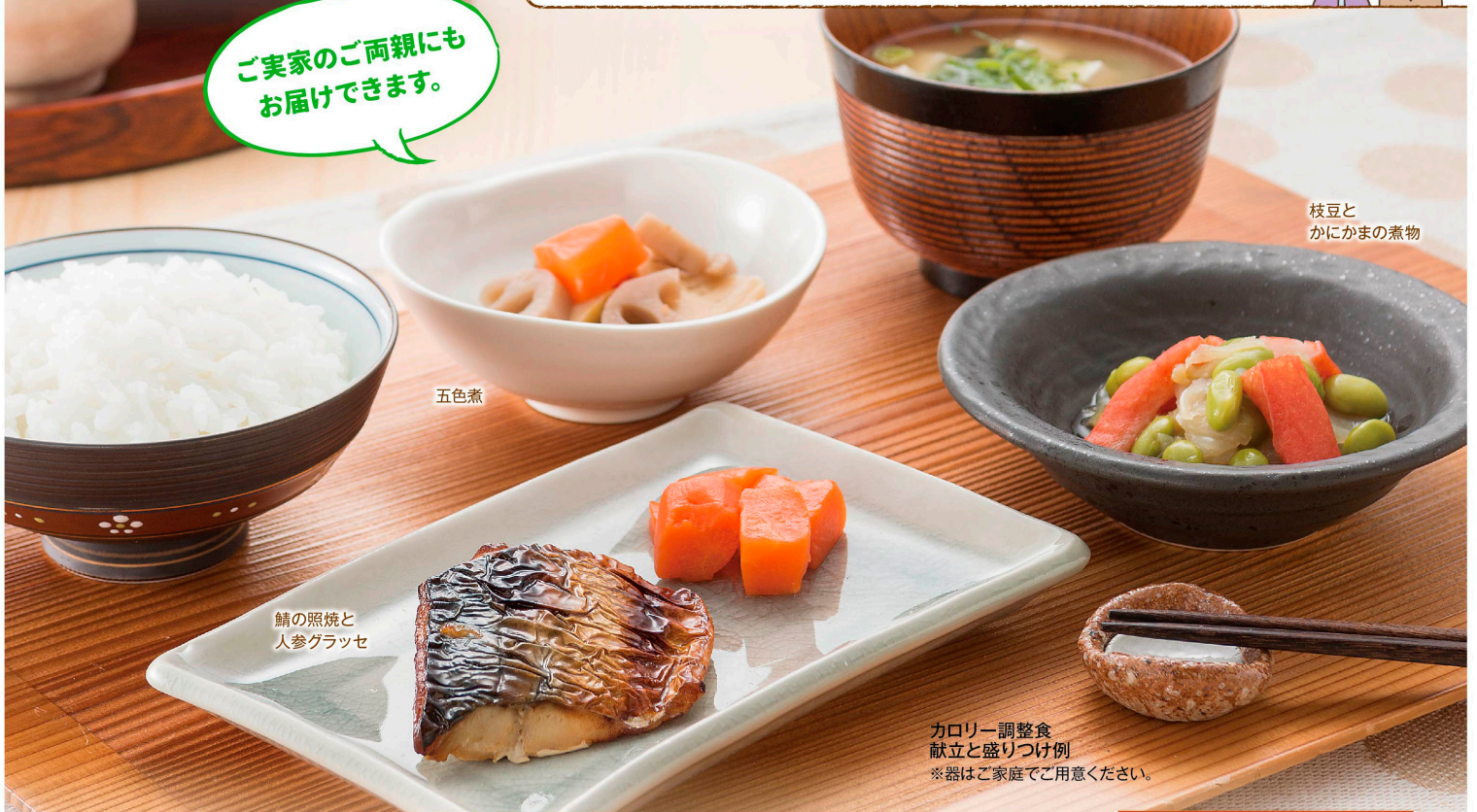
枝豆と かにかまの煮物